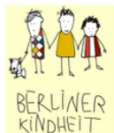
Berliner Kindheit E.S. g...